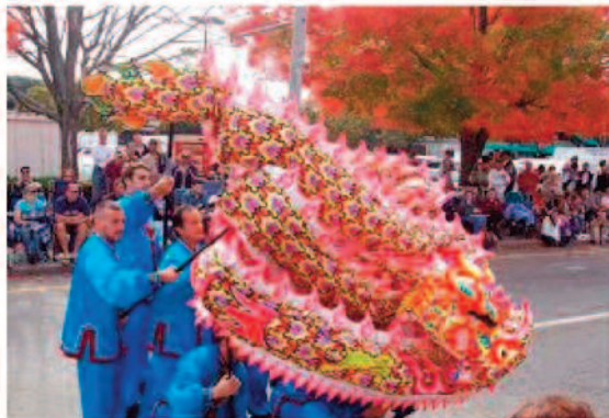
Les spectateurs applaudissent la performance de la danse du dragon.

[Site Clartés et Sagesse] Le 1er octobre 2008, les pratiquants de Falun Dafa ont été invités au 30ème Grand défilé d'Automne de Woonsocket, Ile de Rhode. La section du Falun Dafa comprenait la Fanfare de la Terre divine et un groupe de danse du dragon. Leurs splendides performances ont été acclamées et applaudies par des milliers de spectateurs.