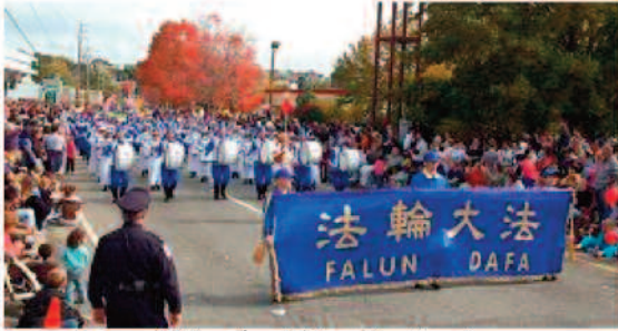
La Fanfare de la Terre divine