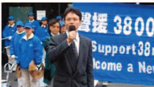
Chen Yonglin un ancien diplomate chinois parle au rassemblement.

[Site Clartés et Sagesse] Le centre du service « Quitter le PCC » à Sydney en Australie a organisé un rassemblement et un grand « Mur de la vérité » dans le Chinatown de Sydney le 14 juin 2008. L'événement souhaitait soutenir les 38 millions de chinois qui ont quitté le PCC et ses organisations affiliées. Le rassemblement a également exposé et condamné le PCC pour avoir donné des instructions à ses organisations à l'étranger pour qu'ils payent des voyous pour encercler le Centre d'aide pour quitter le PCC à Flushing, New York, et attaquer des bénévoles et des pratiquants de Falun Gong sur place.