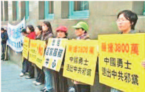
Le rassemblement à Sydney pour soutenir les 38 millions ayant démissionné du PCC.