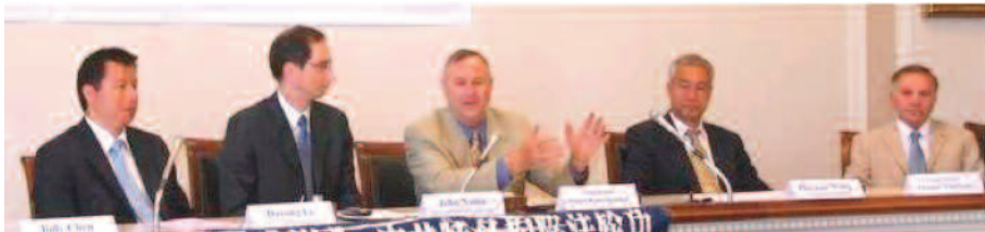
Le 5 juin 2008, les représentants Tom Tancredo (R-CO) (droite) et Dana Rohrabacher (R-CA) (milieu) ont participé à un forum sur l'incident de Flushing dans le Bâtiment du Rayburn House Office à Washington D.C.

Jeudi, les législateurs républicains, Tom Tancredo et Dana Rohrabacher, ont accusé le gouvernement chinois d'être derrière les attaques et ils ont demandé à l'administration du Président George W. Bush de déposer une plainte auprès de Beijing et de demander une explication immédiate. »