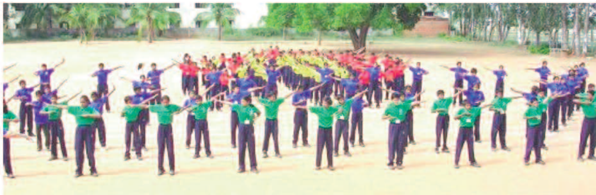
Photo Les élève de l'école d'anglais Sri K. V apprennent les exercices de Falun Gong.

Le directeur a dit que le Falun Gong valait la peine d'être pratiqué et a encouragé tous les enseignants et les professeurs à l'apprendre. Parfois l'école est au grand complet pour faire la pratique ensemble.